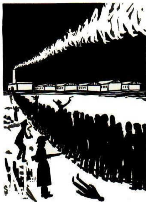
Vchod branou, východ komínem, od Josepha Bau