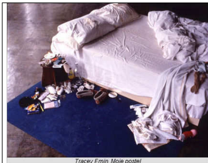
Tracey Emin, Moje postel