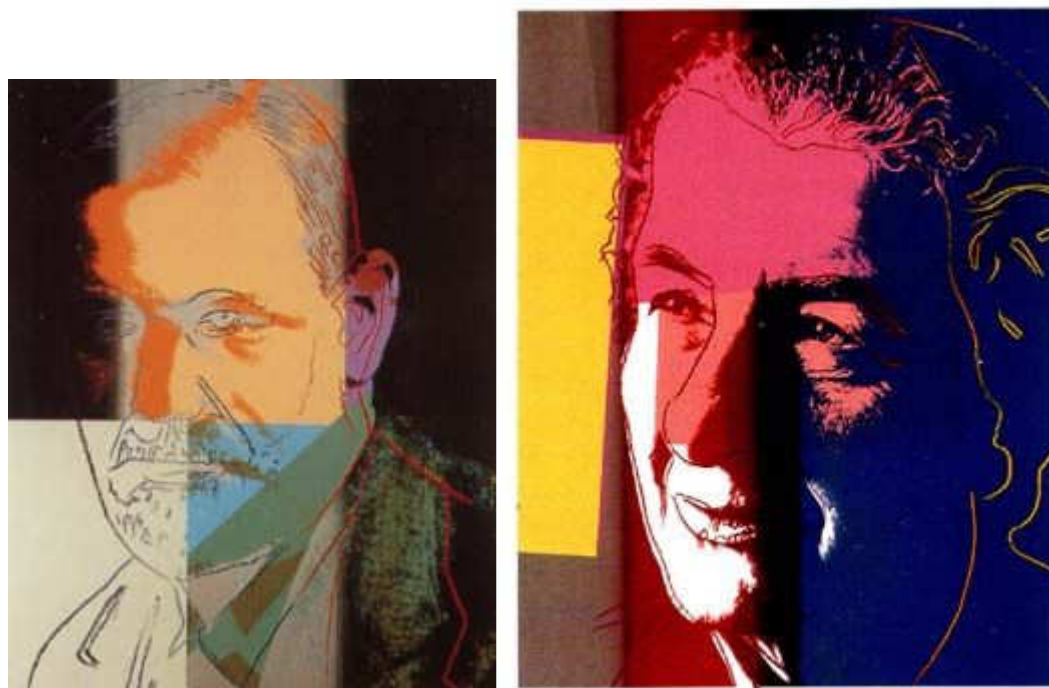
Warholovy portréty Goldy Meirové a Sigmunda Freuda, z jeho série Deset portrétů Židů dvacátého století