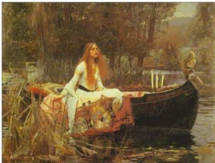
Waterhouse, Dáma ze Shalotu , 1888

Asi o deset let později jsem si položila otázku, o čem vlastně umění je. Jednoho dne jsem objevila následující větu v životopise Burne-Jonese, poznamenala si ji do deníku, a den či dva nad ní přemítala: „Obraz, to je pro mne nádherný romantický sen o něčem, co nikdy nebylo a nebude – v skvělejším světle, než jaké kdy zazářilo – v zemi, na kterou se nikdo nepamatuje ani ji nedokáže popsat, pouze po ní toužit – a vše je obdařeno tvary nadpozemské krásy.“