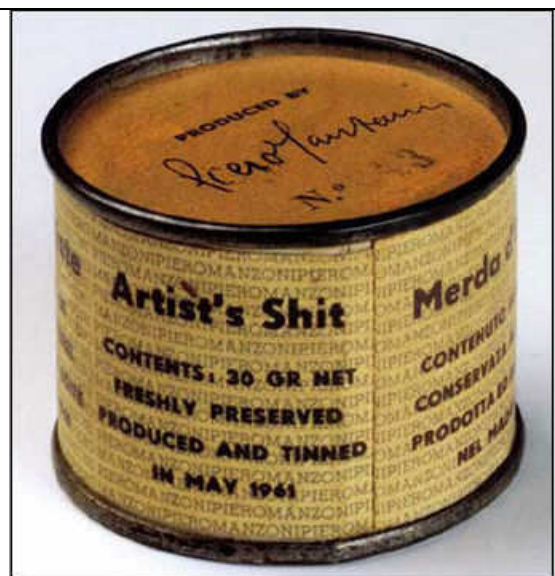
Piero Manzoni, Umělcovo hovno

Shrnuto a podtrženo: Vytvořme kulturu pesimismu. Zdiskreditujme západní civilizaci. Vytvořme svět bez Boha a dožeňme lidi k zoufalství. Zkorumpujme společenské hodnoty a učiňme život nesnesitelným. Stručně řečeno, rozpoutejme peklo na zemi.