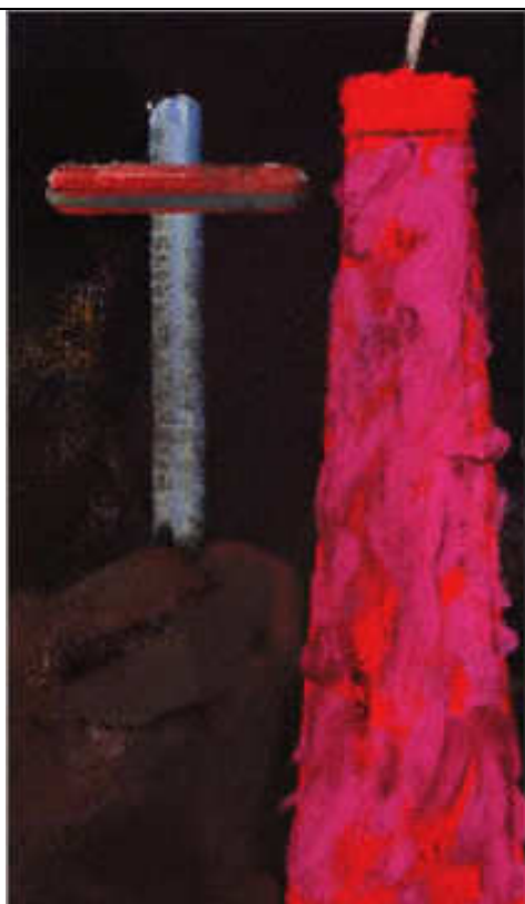
Pašije (1940-45): Kříž a komín